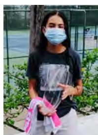
Categoría B Femenino