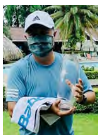
Categoría C Masculino