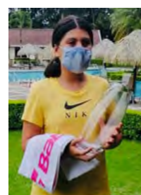
Categoría C Femenino