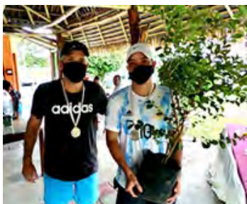
Categoría B Dobles Masculino