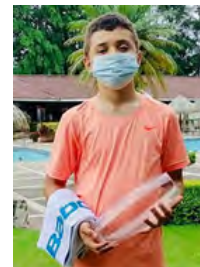
Categoría A masculino